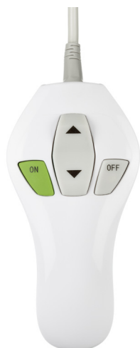
Ergonomisk og brugervenlig håndbetjening

Til professionelle og meget funktionelle plejemiljøer med en harmonisk og menneskelig atmosfære.